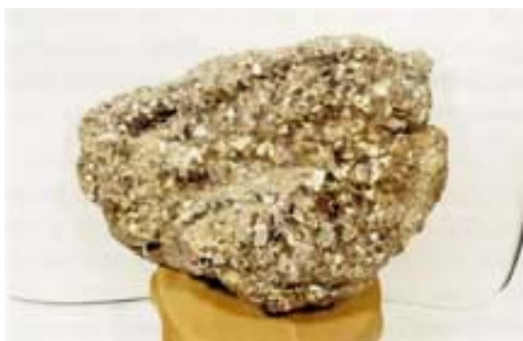
Fig. 3. Pirita de Casapalca (Perú).