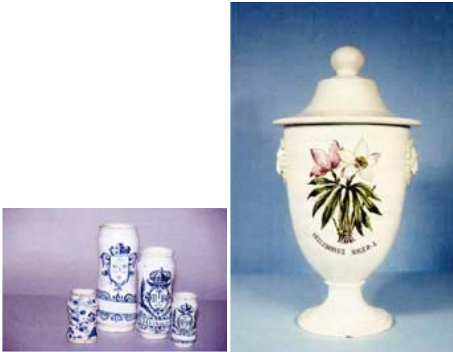
Fig. 2. A) Albarelos de cerámica de Talavera del siglo XVIII. B) Copa de porcelana del siglo XIX.

para óvulos, etc... También existe un conjunto de material de vidrio de finales del siglo XIX y principios del siglo XX procedentes de los fondos del Parque Central de Farmacia Militar.