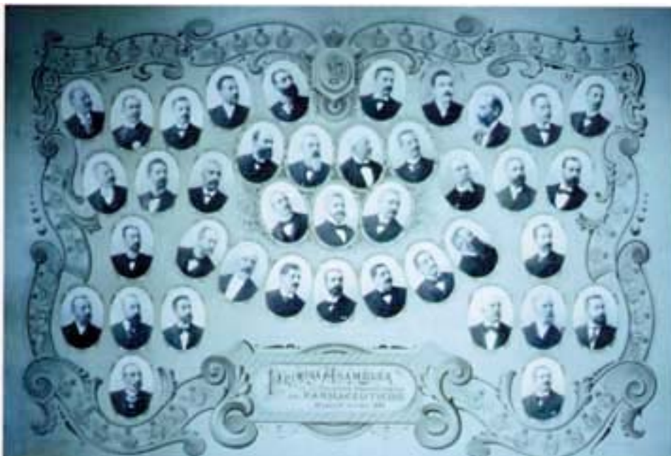
Fig. 5. Orla con las fotografías de los componentes de la Mesa y Representantes oficiales de los Colegios de Farmacéuticos en la Primera Asamblea de Colegios Provinciales de Farmacéuticos. Madrid, 1899.